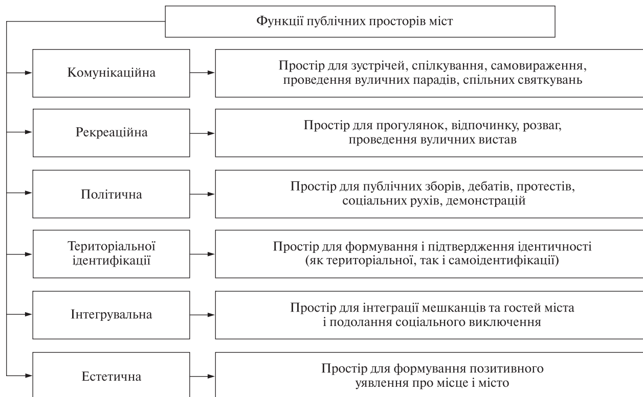
Рис. 1. Функції публічних просторів міст [20, с. 143; 21, с. 40]

мування якісного публічного простору. Місцева влада та громади лише розпочинають співпрацю задля створення публічного простору, тому відставання України усе ще лишається істотним. Відповідно, вивчення досвіду європейських міст (таблиця) допоможе зрозуміти механізми та інструменти побудови публічних просторів, а також розробити алгоритми імплементації кращих практик в українські реалії. Зважаючи на типи міст в Україні (малі — з населенням до 50 тис. осіб, середні — з населенням 50—100 тис. осіб, великі — з населенням 100—500 тис. осіб, дуже великі — з населенням 500 тис. — 1 млн осіб, міста-мільйонери — з населенням понад 1 млн осіб), обрані для дослідження міста є різними за статусом, розміром та кількістю мешканців (Варна: центр Варненської області з населенням понад 350 тис. осіб; Вітербо: столиця провінції Вітербо з населенням приблизно 70 тис. осіб; Гечо: муніципалітет у провінції Біскайя з населенням понад 80 тис. осіб; Копенгаген: столиця з населенням понад 600 тис. осіб; Мальме: адміністративний центр регіону з населенням понад 300 тис. осіб).