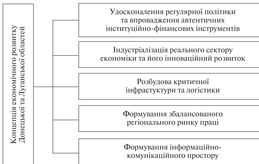
Групи заходів для реалізації Концепції економічного розвитку Донецької та Луганської областей

територій України разом із зацікавленими центральними та місцевими органами виконавчої влади за участі органів місцевого самоврядування [1].