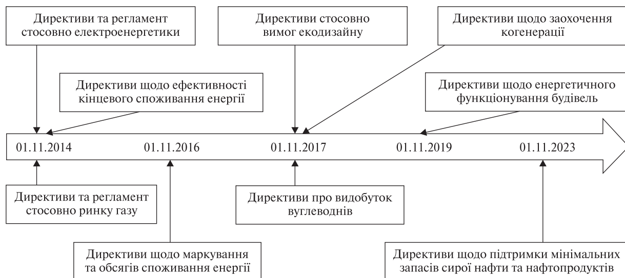
Рис. 4. Графік імплементації європейського енергетичного законодавства

цим має бути проведена двостороння процедура погодження вже нових актів, які необхідно імплементувати з офіційним закріпленням переліку усіх нормативних документів по кожній сфері.