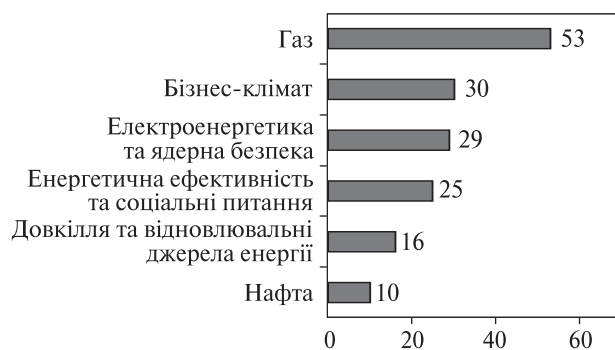
Рис. 3. Оцінка прогресу імплементації у сферах енергетики, енергоефективності та довкілля на початок 2017 р. (бальна оцінка)

ня норм Директив 2012/27/ЄС та 2010/31/ЄС. Так, Директива 2012/27/ЄС, окрім загальних цілей країни з енергоефективності, містить також цільові показники щодо розміру площі громадських будівель, яка має бути модернізована, а також вимоги до організації системи ЕСКО (енергосервісних компаній), стандартів енергоаудиту та енергоменеджменту тощо.