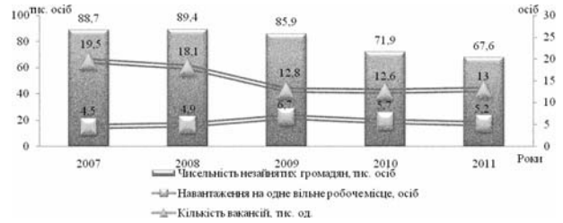
Рис. 3. Попит і пропозиція на зареєстрованому ринку праці Донецького регіону у 2007–2011 рр.

За останні два роки кількість вакансій зменшується, рівень зареєстрованого безробіття