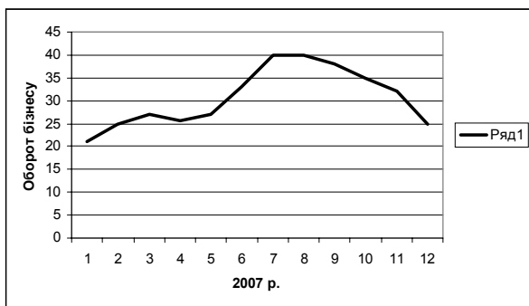
Рис. 2. Додаткові обороти бізнесу, мультиплікатор продажів дорівнює 3.854

Розрахований на основі обсягів продажів рекреаційних і супутніх послуг підприємствами м. Бердянська у 2007 р. (оборот рекреаційного бізнесу) мультиплікатор склав 3.854. Тобто на кожен додатковий гривню витрат туристами рекреаційний бізнес реагує зростанням ділової активності у грошовому вимірі майже у чотири рази.