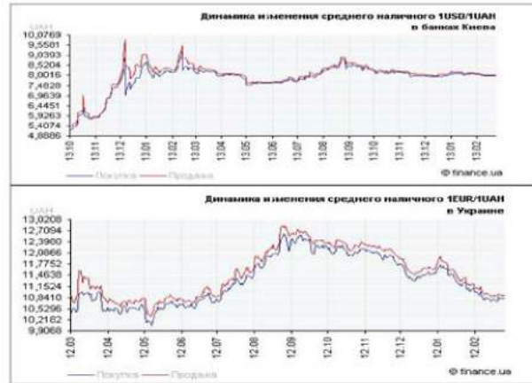
Рис. 3. Фрагменты графиков динамики изменений среднего наличного курса покупки и продажи $ и EUR по отношению к гривне

Графики динамики изменений среднего наличного курса покупки и продажи $ и EUR свидетельствуют о наличии колебаний, при чем они не имеют общей тенденции (роста или снижения), что также подтверждает нестабильность национальной денежной единицы. Дополняя экономическую сущность понятия «стабильность национальной валюты Украины», необходимо рассмотреть юридическую составляющую указанной дефиниции.