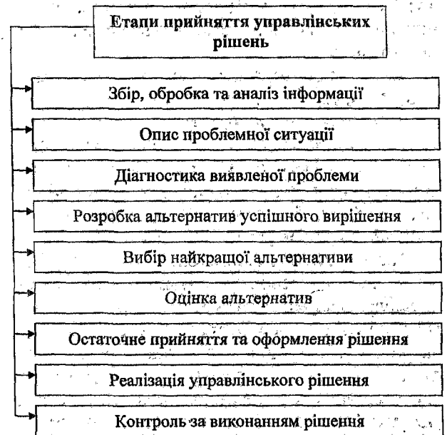
Рис. 2. Етапи прийняття управлінських рішень

Існує інше бачення етапів прийняття управлінських рішень (рис. 2) [7].